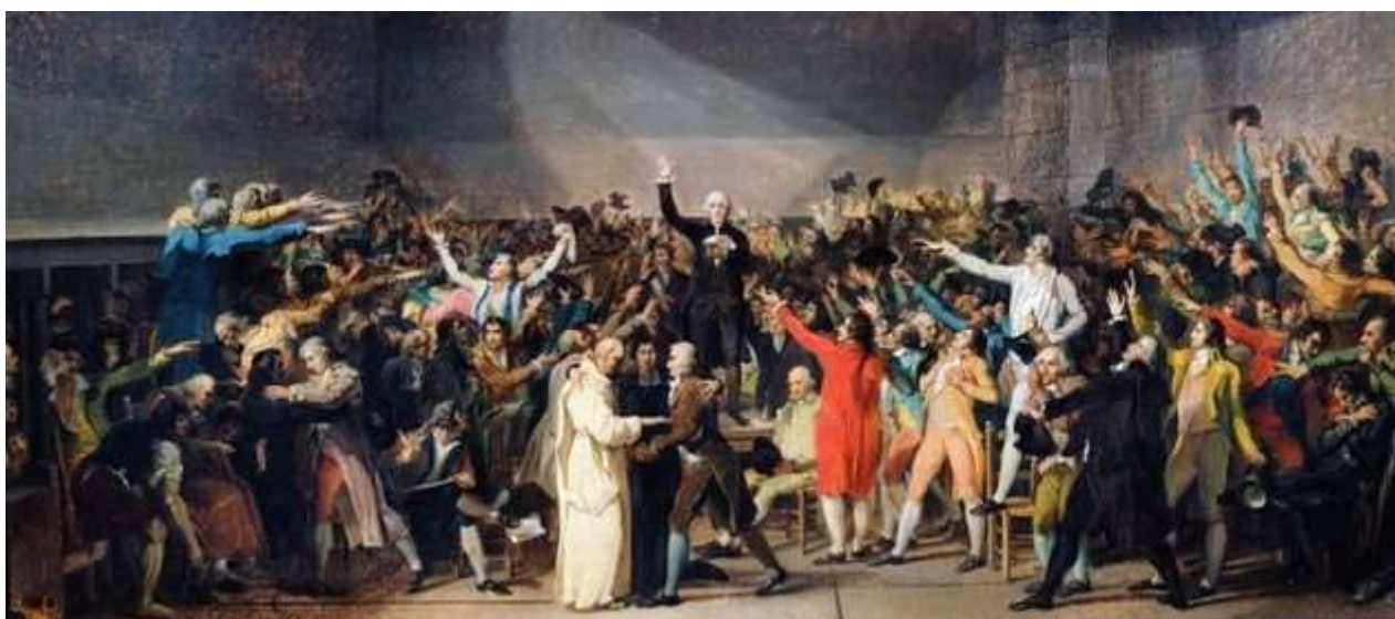
"O juramento na Sala de Jogo de Paume" , de Jean-Louis David, ilustra a união entre parte do Segundo Estado e o Terceiro.

Em seguida, declaram-se representantes da nação, formando a Assembleia Nacional Constituinte e jurando permanecer reunidos até que ficasse pronta a Constituição.